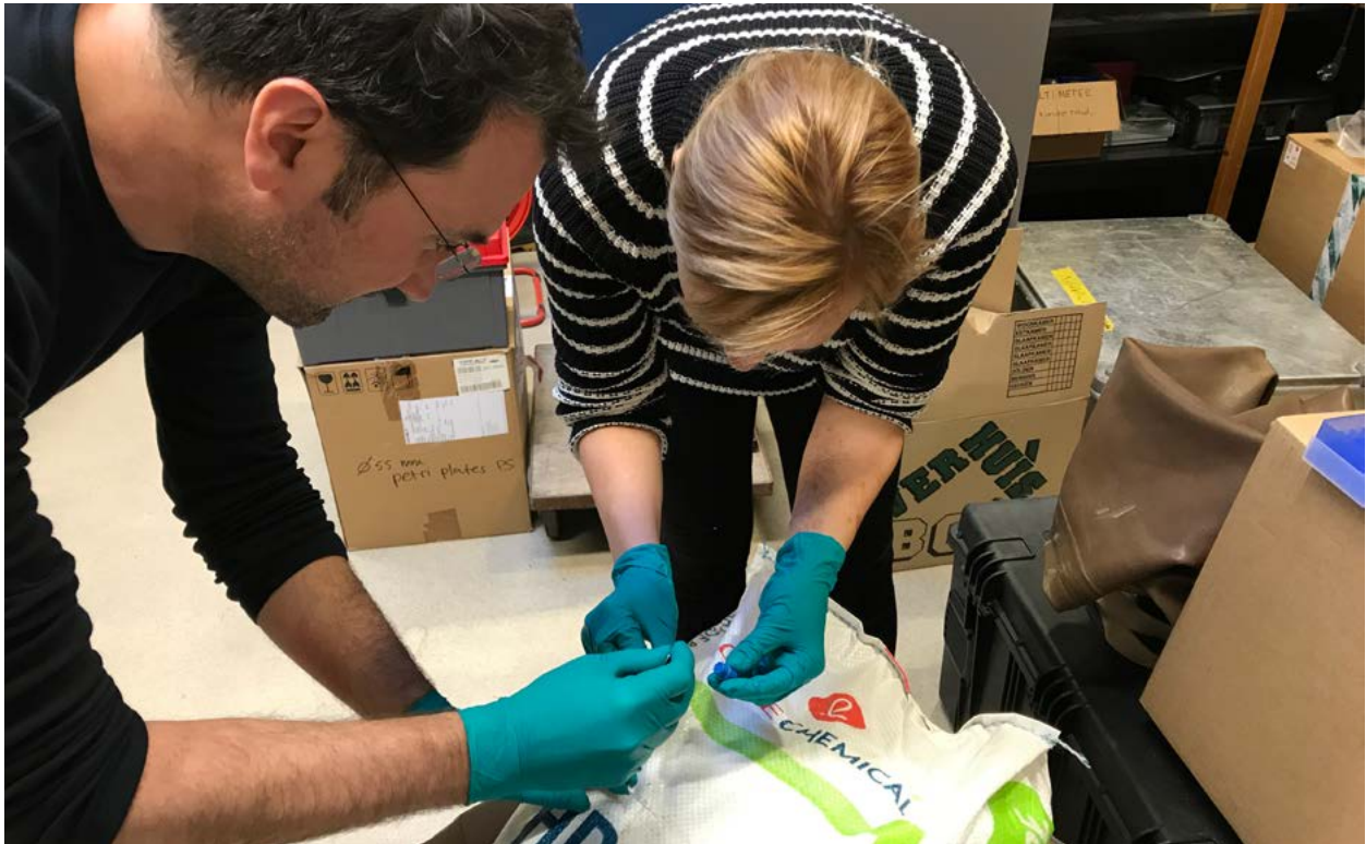
| Bemonstering van HDPE-pellets afkomstig van Schiermonnikoog op het Koninklijk NIOZ op Texel 60 .

Onderzoeksvragen hierbij zijn onder meer: